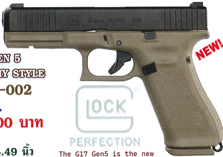
G17 Gen5 French Army Style