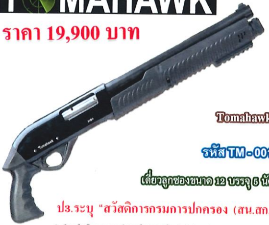
Tomahawk รหัส TM-001 เดี่ยวลูกของขนาด 12 บรรจุ 5 นัด

ป.ร.ระบุ "สวัสดิการกรมการปกครอง (สน.สท.)"