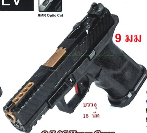
O.Z-9C Hyper-Comp รหัส ZV-007 ราคา 99,500 บาท