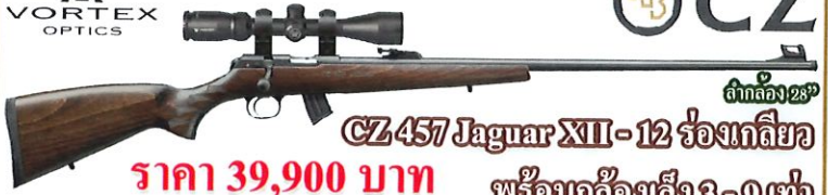
จ่ากลอง 28" CZ 457 Jaguar XII-12 ร้อยกลเดียว พร้อมกล้องตั้ง 3-9 เท่า ราคา 39,900 บาท