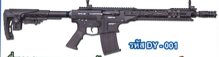
เดี่ยวลูกของขนาด 12 บรรจุ 5 นัด รหัส DY-001 ใบอนุญาต ป.ร.ระบุ "สวัสดิการกรมการปกครอง" ราคา 39,900 บาท