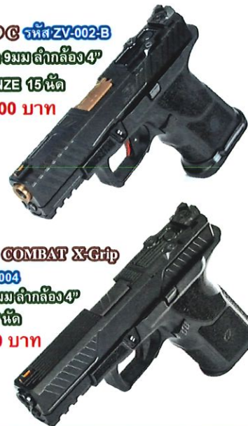
O.Z-9c COMBAT X-Grip รหัส ZV-004 ขนาด 9 มม ลักกล้อง 4" บรรจุ 17 นัด 79,900 บาท

O.Z-9C รหัส ZV-002-B ขนาด 9 มม ลักกล้อง 4" BRONZE 15 นัด 99,500 บาท