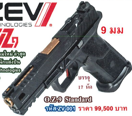
O.Z-9 Standard รหัส ZV-001 ราคา 99,500 บาท

นวัตกรรมใหม่ล่าสุด จากสำนักต่งปิ่น Zev Technologies รุ่น OZ9 ขนาด 9 มม. บรรจุ 17 นัด