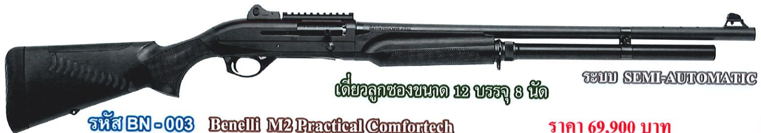
เดี่ยวลูกของขนาด 12 บรรจุ 8 นัด ระบบ SEMI-AUTOMATIC รหัส BN-003 Benelli M2 Practical Comfortech ราคา 69,900 บาท ใบอนุญาตป.ร.ระบุ "สวัสดิการกรมการปกครอง"