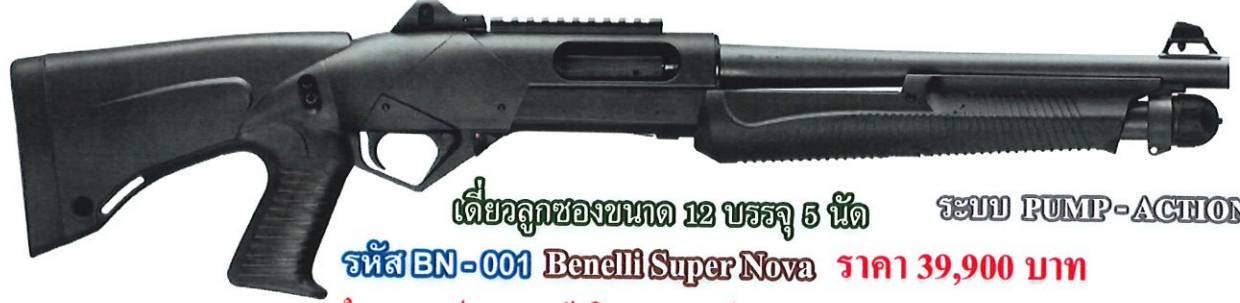
เดี่ยวลูกของขนาด 12 บรรจุ 5 นัด ระบบ PUMP-ACTION รหัส BN-001 Benelli Super Nova ราคา 39,900 บาท ใบอนุญาตป.ร.ระบุ "สวัสดิการกรมการปกครอง"